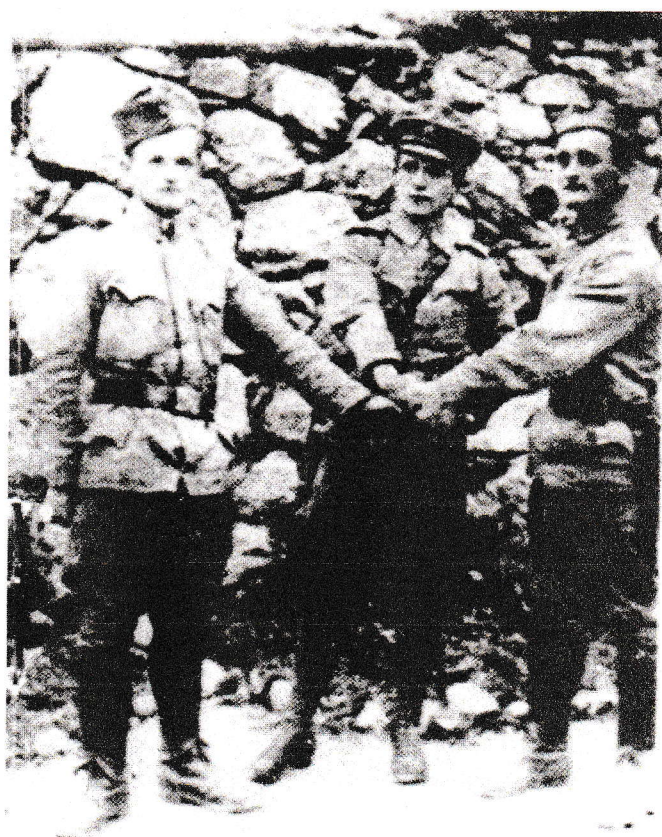
S soborcema Ahačičema na Ljubelju 1918