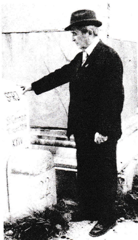
Ude vrh Ljubelja 1979

za slovensko severno mejo v letih 1918 in 1919. Odvetniško prakso je po študiju opravljal v Prekmurju in na Štajerskem in v tem obdobju tudi začel živo posegati v javne polemike o slovenskem narodnostnem vprašanju. Njegovo poglobljeno publicistično delo in kasneje znanstveno zgodovinsko raziskovanje je bilo usmerjeno na obdobje prehoda Slovencev iz Avstro-Ogrske v Jugoslavijo. Posebej velja to za prehod in usodo severnih obmejnih Slovencev. V bogatem znanstvenem raziskovalnem opusu je svoje temeljno zgodovinsko zanimanje strnil v treh knjigah. V delu Slovinci in jugoslovanska skupnost (1972) je povzel historične razprave o Slovincih in jugoslovanski ideji v letih 1903 - 1914, upore slovenskega vojaštva v avstro-ogrski vojski in oceno glavnih publikacij iz zgodovine prehoda iz Avstro-Ogrske v Jugoslavijo. V knjigi Boj za slovensko severno mejo 1918-1919 (1977) je objavil gradivo o vojaškem in političnem položaju od zloma Avstro-Ogrske naprej. S knjigo Koroško vprašanje (1976) se je lotil še vedno aktualnega vprašanja avstrijskega problema, odgovornosti Avstrije in napredne zaščite narodnih manjšin. V njej obravnava kriterije ugotavljanja